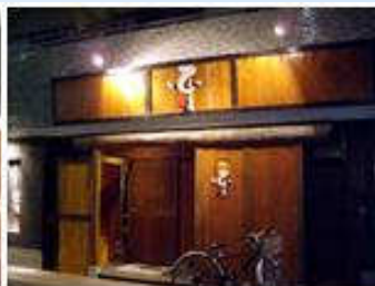
居酒屋というより、割烹に近い「平」の店構え