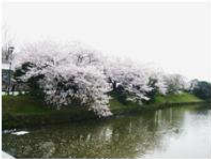
大手門の対岸の土手は桜が満開

桜の季節も終わりましたが、今月は桜の名所～舞鶴公園を見渡す大手門界限をお送りします。舞鶴公園は福岡城址に設けられた公園で、桜の名所としてこの季節は花見客で溢れかえるスポットです。大手門とは、日本の城郭における二の丸または三の丸などの曲輪へ通じる虎口に設けられた門のことを指すようで、いわゆる正門にあたる門です。城によっては追手門と書く場合もあります。一般には防御のための厳重な築造がされ、大規模な櫓門を築いて、見た目も大きく目立つように作られています。これに対して背面の門は搦手門（からめてもん）と呼ばれるそうですが、福岡城址の周囲にはそのような地名は今はありません。福岡の大手門は福岡城のお堀端に面し、春は桜、夏は蓮が満開となる風景を目の当たりにする素敵な場所でもあります。