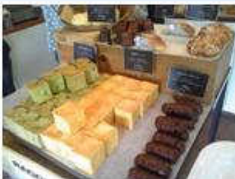
ラググルッピーのパンはこんな感じです