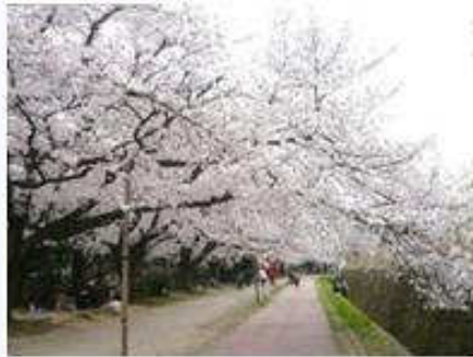
桜並木を歩くと異次元の世界のよう