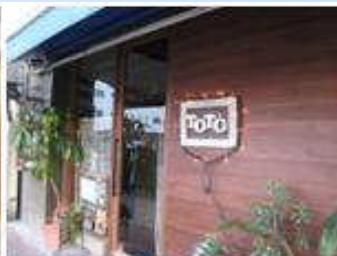
TOTOは小さな間口ですが、奥行きは結構あります