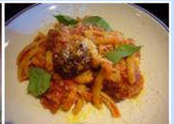
TOTOのパスタはどれも絶品です