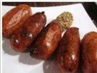
Coutaのフランクソーセージはボリュームが凄い