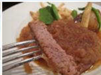
ラググルッピーは食事もなかなか充実しています