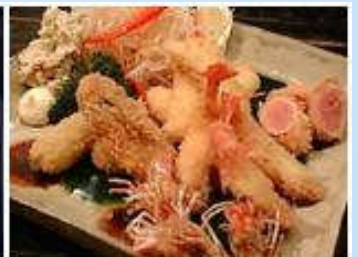
「平」の揚げ物の盛り合わせもボリュームたっぷり